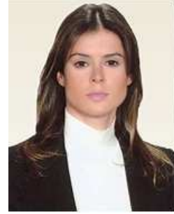
Serra Sabancı Yönetim Kurulu Başkan Yrd.